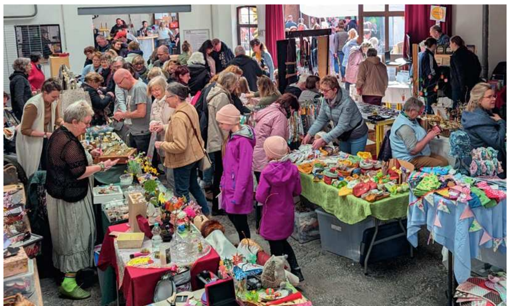
Der Osterburger Ostermarkt ist jährlich einer der Besuchermagneten des Kreismuseums Osterburg, so war es auch im Jahr 2024.

Mit Handwerk und Puppenspiel Kreismuseum Osterburg organisiert am 19. April den 31. Ostermarkt.