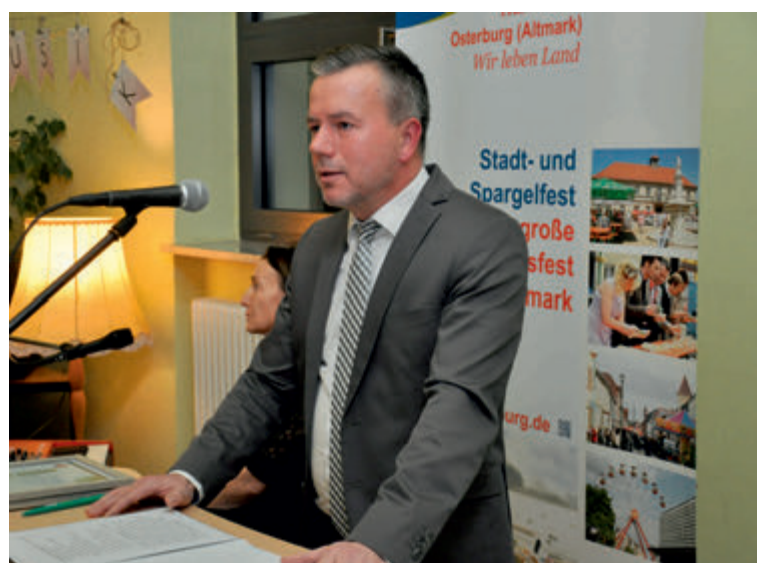
Bürgermeister Nico Schulz bei seiner Neujahrsrede für 2023