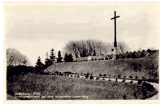
Schlageterkreuz auf dem Weinberg, Postkarte um 1935

Vor 90 Jahren lockte die an mehreren Tagen festlich begangene 1000-Jahr-Feier der Stadt Tangermünde auch zahlreiche Kreiseingesessene zu Besuchen. Hierzu eingesetzte Extrabusse wurden bereitwilligst frequentiert. Den Höhepunkt bildete dabei die Weihe der großen in den Jahren 1931 bis 1933 gebauten Elbbrücke am 10. September. In der „Altmärkischen Zeitung“, Nr. 212, vom 11. September 1933 heißt es dazu u. a.: „Die Stadt Tangermünde feiert in diesen Tagen ihr tausendjähriges Bestehen. Im Mittelpunkt der Feiern, die sich über die ganze Woche erstrecken, und neben anderem einen Jäger- und Schützenfesttag, einen Sport-, Jugend- und Wanderring, zwei große Festspiele vorsieht, stand die Weihe einer der größten (850 Meter langen) Brücken Deutschlands, die zugleich die erste Straßenbrücke auf der Stromstrecke zwischen Magdeburg und Harburg ist.“ – Nach nicht ganz zwölfjähriger Nutzung wurden die Stromfelder dieser Stahlbrücke am 12. April 1945 von der Wehrmacht gesprengt, um die heranrückenden Amerikaner aufzuhalten. Eine Behelfsbrücke aus Holz leistete darauf für einige Jahre Dienste, bis die alte Brücke im September 1950 wieder aufgebaut wurde. Die noch bis 2001 genutzte alte Elbbrücke mit Holzfahrbahn wurde 2003 zurückgebaut. Eine an anderer Stelle gebaute moderne Stabbogenbrücke ersetzt seitdem diese alte Brücke.