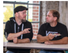
Schwedler & Bartels