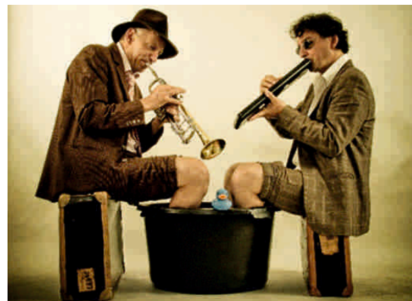
Huub Dutch Duo

Der Eintritt beträgt 10 Euro. Karten werden an der Abendkasse vor Ort verkauft. Zur besseren Planung wird für das Konzert am Freitag in Gardelegen um Voranmeldung unter der Telefonnummer 03907 - 7020 und für Samstag in Iden unter der Telefonnummer 03931 - 608010 gebeten.