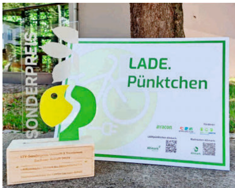
LTV-SUNK-Umweltpreis 2023 an AltmarkMacher e.V. für das Projekt „LADEpüñktchen Altmark“

Die 30 x 40 cm großen Schilder können gern von allen, die sich am Projekt beteiligen, abgeholt werden. Dazu wurden verschiedene Verteilstationen in der Altmark eingerichtet. In der Einheitsgemeinde Osterburg ist dies das Atelier offen Krevese, Kontakt: 0162 7485479, bitte vor Schildabholung anrufen! Weitere Informationen unter www.altmarkmacher.de/machen