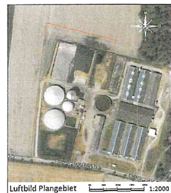
Luftbild Plangebiet 1:2000